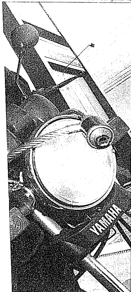
quem está na rua só para 'bagunçar'